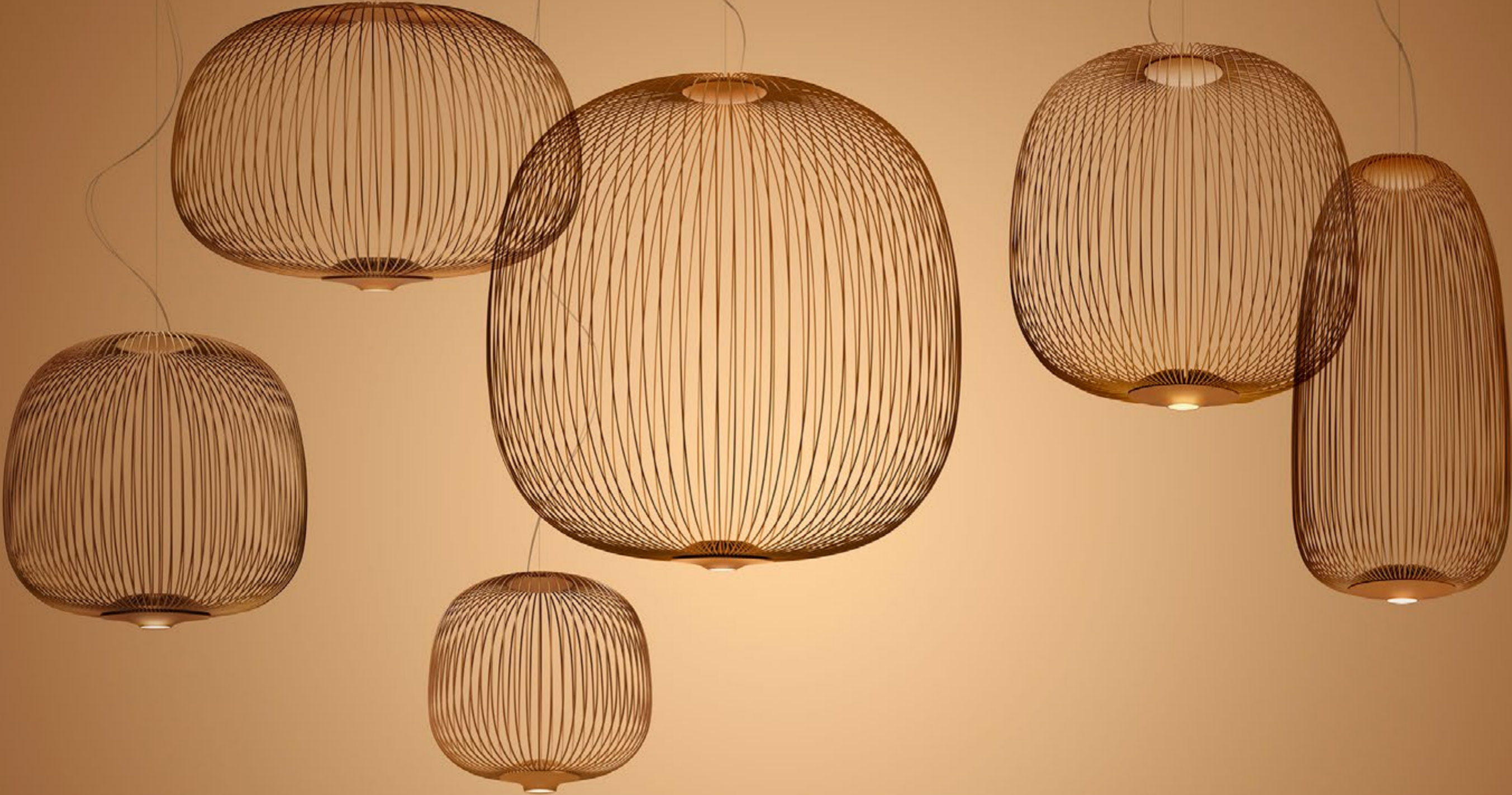
Spokes 2 MIDI