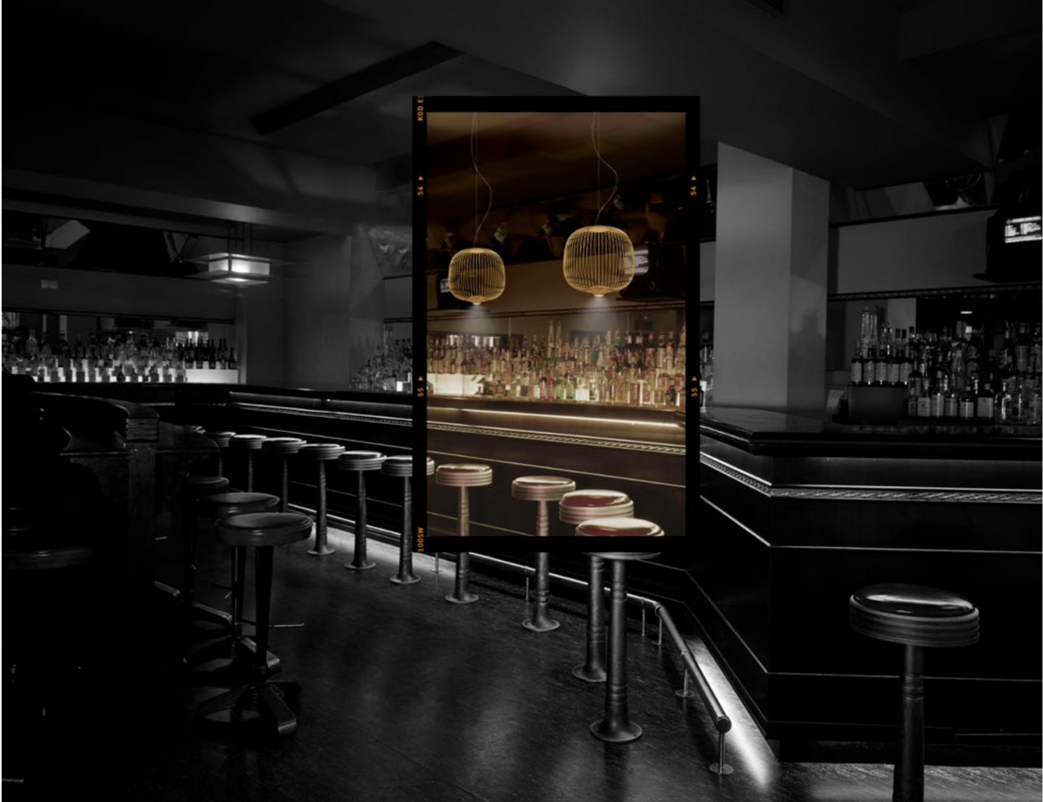
Mark Fiennes, interior of a bar, Soho, London, c.1987.