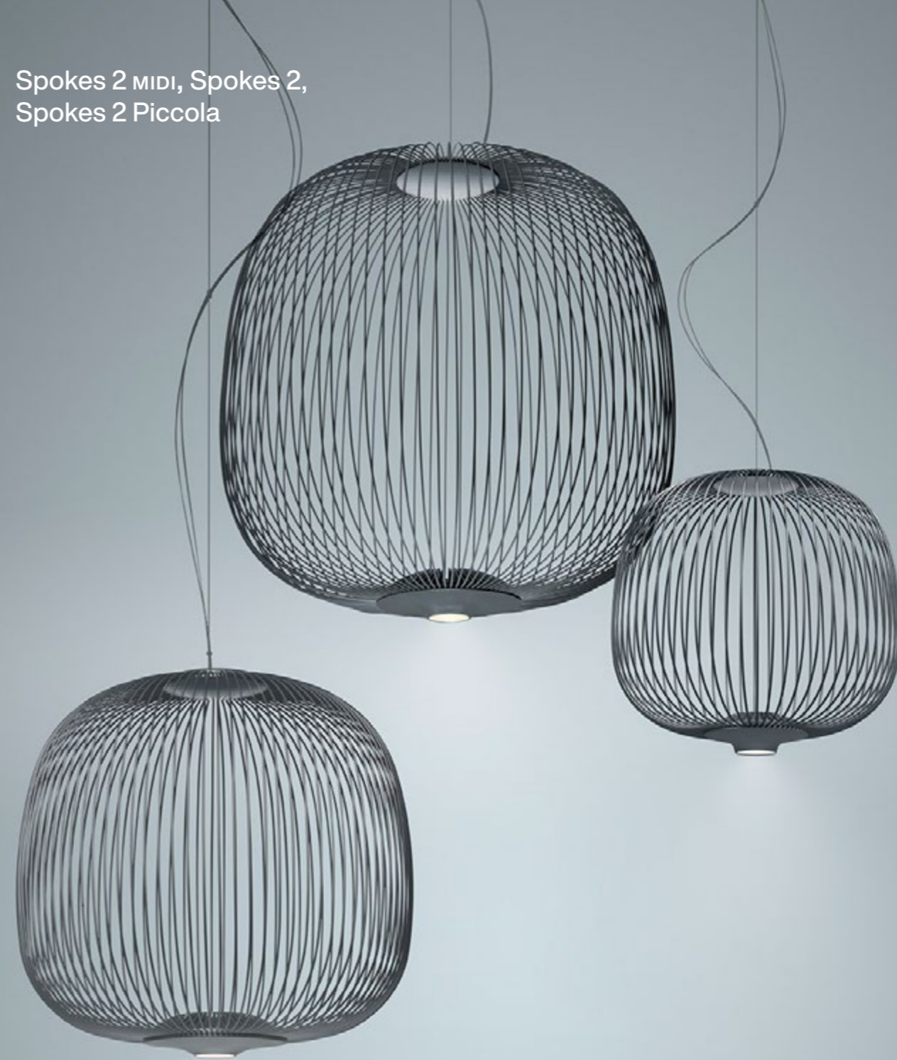
Spokes 2 MIDI, Spokes 2, Spokes 2 Piccola

All the forms are available in 5 different colours: white, black, graphite, gold and copper.