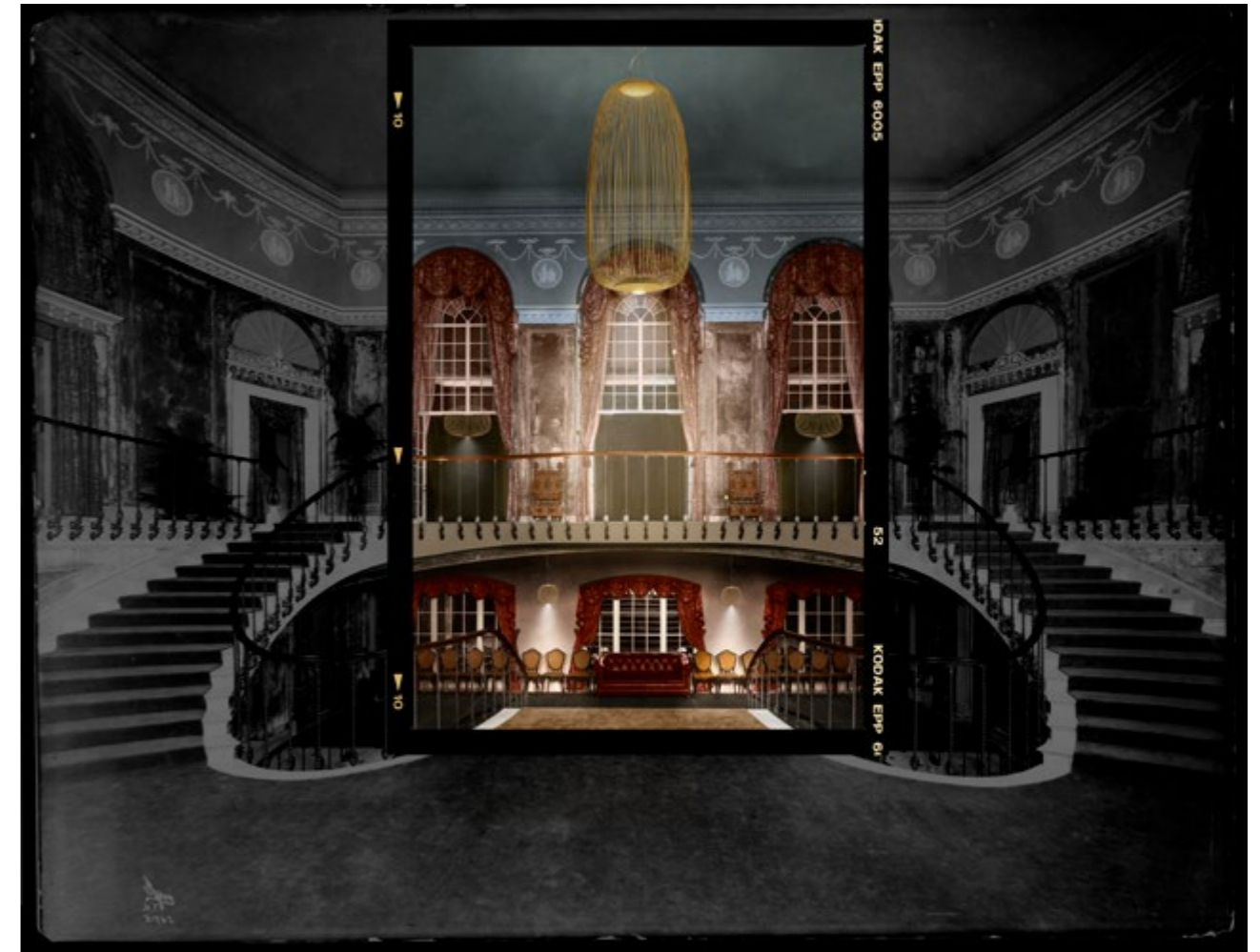
Byron Company, double staircase at the Ritz-Carlton Hotel, 1913.