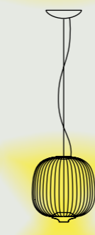
Spokes 2 Piccola