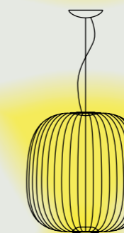
Spokes 2 Large