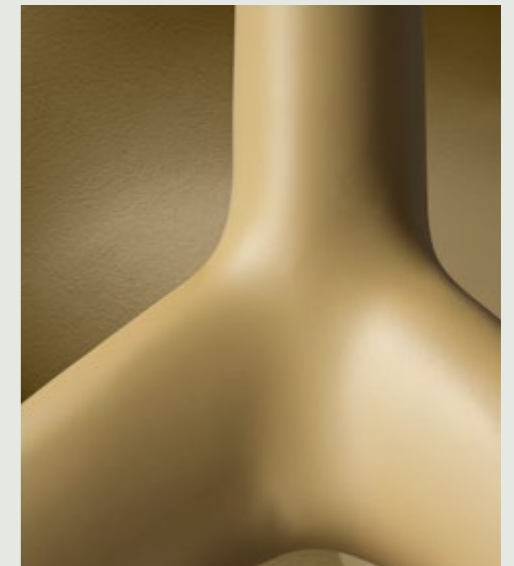
Table lamp for direct and diffused lighting. Diffuser in coated handmade blown glass with glossy finish, white on the inside, coloured on the outside. Tripod base and fastener cap in matte liquid-coated die-cast aluminium; feet in scratchproof silicone. New internal lamp housing in transparent PC for the upper part, opaline PMMA for the lower part. Dimmer control on transparent cable in the 220/240V version, on/off switch in the 120V version.

Lampada da tavolo a luce diretta e diffusa. Diffusore in vetro incamiciato con finitura lucida, soffiato a bocca bianco all'interno e colorato all'esterno. Base treppiede e tappo ferma vetro in pressofusione d'alluminio verniciato a liquido opaco; piedini in silicone anti graffio. Nuova struttura interna per alloggiare la lampadina in PC trasparente nella parte superiore e in PMMA opalino in quella inferiore. Dimmer che consente la regolazione a gradazione sul cavo trasparente nella versione 220/240V e interruttore on/off nella versione 120V.